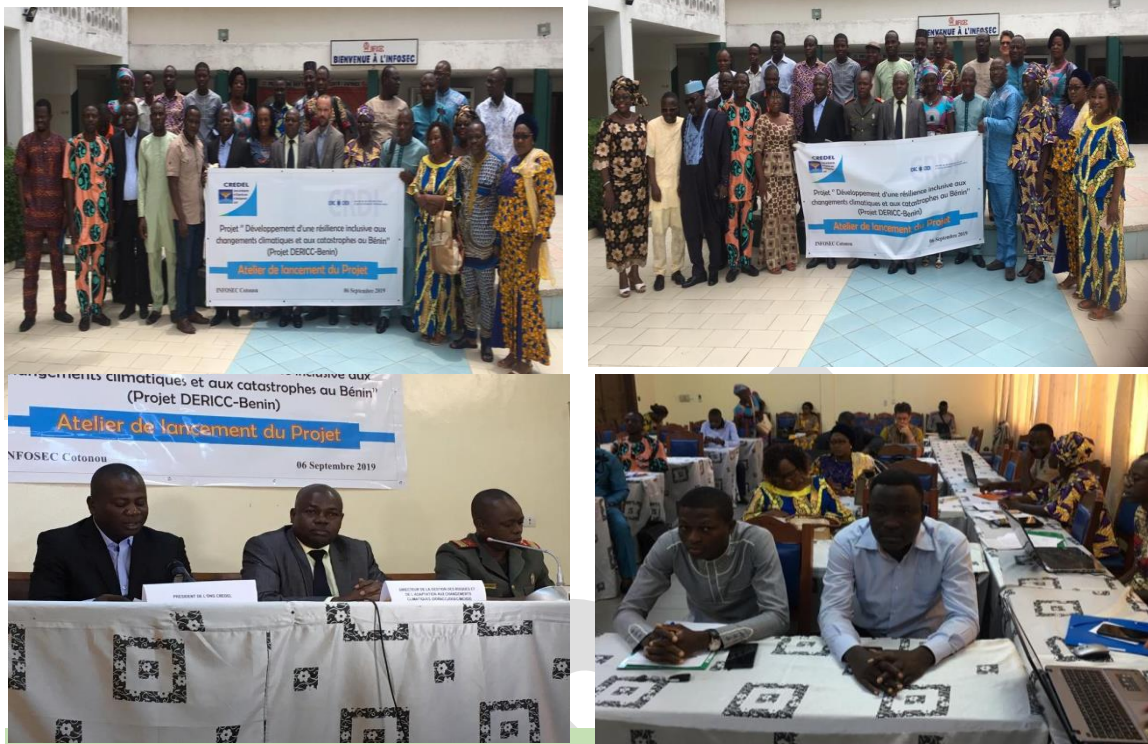
Atelier du lancement du Projet DERICC