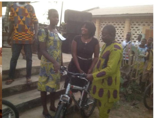
L'ambassadrice intercommunale GIRE 2019 en train de recevoir son lot