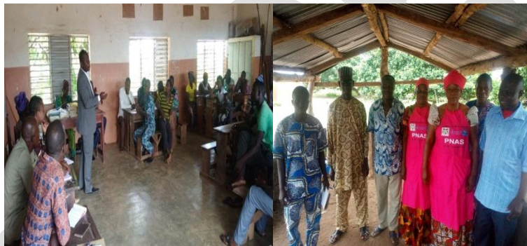
Assemblée Générale de sensibilisation à Gobé/Savè, janvier

Les 06 maires du département ont été rencontrés, le DDEMP, le CSAS, le Représentant du Préfet des collines, les 3 CRP ont été rencontrés à plusieurs reprises dans le cadre de la mise en œuvre du PNASI. Plus de 286 Chefs Villages, 348 Chefs Quartiers, 39 Chefs d'Arrondissement et plus de 550 leaders d'opinion ont été rencontrés et sensibilisés. Des sensibilisations porte à porte et de masse ont été organisées dans le but d'atteindre un plus grand nombre de la population. Les descentes du DE et du PA ont renforcé l'équipe terrain dans la résolution des difficultés qui se sont posées. La crise après le vol de vivres à GOBE QUARTIER A en est un exemple.