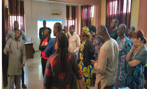
Atelier de formation sur le renforcement de capacités/Gender at Work du projet DERICC

La seconde partie de la formation a été consacrée à la journée Gender at Work. Cette journée a permis aux différents participants, de mieux comprendre l'intégration du concept Genre et Inclusion dans les activités du Projet DERICC, de discuter sur les changements ou résultats souhaités à la fin du projet au travers de la matrice analytique et enfin de ressortir les pistes de collaboration entre l'ONG CREDEL (à travers le Projet) et Gender at Work.