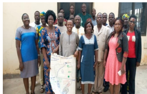
Membres de l'équipe du projet lors de la formation de renforcement de capacités

A la suite de l'atelier méthodologique du Projet DERICC-Bénin, il a été procédé à un atelier de formation sur les outils de l'approche CVCA 2.0 développés par CARE International et les approches Genre sensible de Gender at Work. Cette formation a regroupé les membres de l'équipe du Projet, les membres du Laboratoire LACEEDE, les points focaux des communes bénéficiaires et les Ministères et Agences partenaires du Projet. Elle a eu lieu du 22 au 26 Juillet 2019 dans la commune de Lokossa.