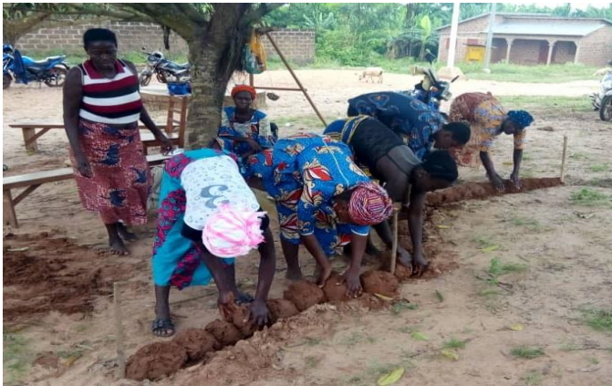
Réalisation de cordons pierreux par les groupes organisés de Ouinhi

Au nombre des activités réalisées et qui rentrent en ligne de compte pour les résultats 2 et 3, il faudra retenir la réalisation de l'étude d'impact de la filière sable en vue de déterminer les actions concrètes à mener dans une perspective d'amélioration et de structuration de la filière. Aussi, les communautés dans une logique de responsabilisation ont été renforcées sur les techniques de Conservation des Eaux et du Sol. Ceci a suscité une prise de conscience au niveau de la plupart des communautés qui commence par appliquer de façon volontaire certaines notions acquises en attendant l'appui du projet pour concrétiser les micro-actions GIRE de proximité.