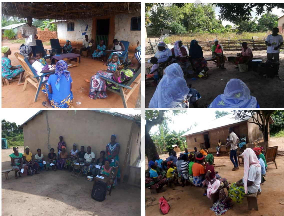
Rencontre avec les différents groupements Projet DERICC-Bénin/CREDEL, novembre 2019

Plusieurs groupements ont été recensés lors de la phase d'enquête réalisée par l'équipe du Laboratoire LACEEDE. Le rapport préliminaire a permis d'avoir une liste de différents groupements par commune (respectivement Adja-Ouèrè, Ouinhi, Ouidah, Athiémé, Glazoué, Savê, Djougou et Ouaké). Cette liste a servi de support pour les visites afin d'informer ces groupements de la mise en œuvre du projet et pouvoir recueillir des informations sur leur fonctionnement, l'organisation, les lieux et date de rencontre, l'effectif de chaque groupement.