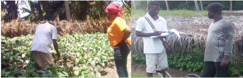
Enquête auprès des producteurs / Campagne de sensibilisation

C'est la dernière phase de la première partie de la campagne, elle a permis de réaliser des enquêtes auprès de 350 producteurs répartis dans plusieurs villages que sont Kouvénanfidé, Dégoué, Djègbadji dans l'arrondissement de Djègbadji, Towinou, Houakpè Daho dans l'arrondissement de Houakpè Daho, Ahouandji, Avlékété Centre ; Agbazinkpota, Hio Houta et Adounko dans l'arrondissement d'Avlékété. Cette phase a permis d'aller au contact des personnes ciblées pour le changement de comportement à savoir les agriculteurs et pouvoir recueillir des informations pour faciliter la mise en œuvre de la campagne.