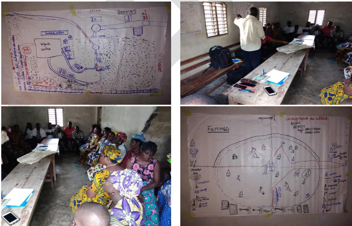
Séance de Pré-Test à Dégouè

Pour s'assurer du bon déroulement et de la maîtrise des outils du CVCA 2.0 par l'équipe du projet notamment les Animateurs du Projet, conformément aux recommandations issues de l'atelier de formation, une séance de pré-test a eu lieu avec le groupement TONAGNON dans le village de Dégouè dans l'arrondissement de Djègbadji, commune de Ouidah. Cette séance a permis d'informer les membres du groupement sur l'ONG CREDEL et le projet DERICC. Ensuite le groupement s'est subdivisé en deux : celui des hommes et celui des femmes. Il s'en est donc suivi la réalisation des cartes des ressources et des aléas du village Dégouè.