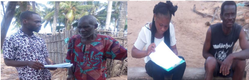
Enquête auprès des producteurs / Campagne de sensibilisation

C'est la dernière phase de la première partie de la campagne, elle a permis de réaliser des enquêtes auprès de 350 producteurs répartis dans plusieurs villages que sont Kouvénanfidé, Dégoué, Djègbadji dans l'arrondissement de Djègbadji, Towinou, Houakpè Daho dans l'arrondissement de Houakpè Daho, Ahouandji, Avlékété Centre ; Agbazinkpota, Hio Houta et Adounko dans l'arrondissement d'Avlékété. Cette phase a permis d'aller au contact des personnes ciblées pour le changement de comportement à savoir les agriculteurs et pouvoir recueillir des informations pour faciliter la mise en œuvre de la campagne.