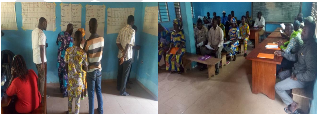
Atelier d'Analyse Participative des Risques et Vulnérabilités

L'objectif général de cette activité est de renforcer les capacités des membres des instances communales, départementales et nationales sur les CC et de définir de façon participative avec les agriculteurs et acteurs locaux, les risques et les impacts des CC, prioritairement sur les filières ciblées par le projet et d'identifier les stratégies d'adaptation liées à ces risques.