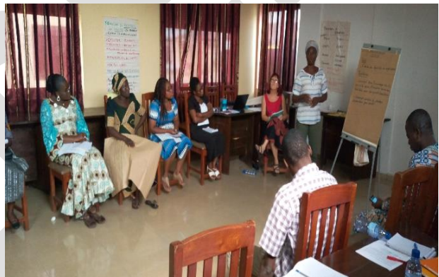
Atelier de formation sur le renforcement de capacités du projet DERRIC

➤ la rédaction des rapports d'étape de l'analyse diagnostique CVCA pour chacune des communautés visitées sur la base du canevas de rapportage remis aux équipes ;