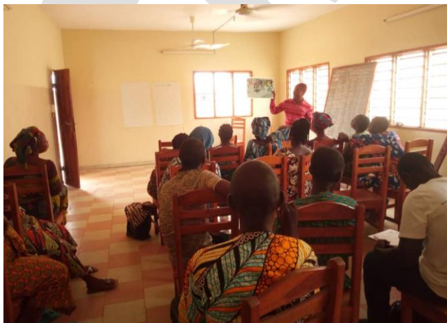
Sensibilisation des relais communautaires de l'arrondissement d'Avlamè sur la GIRE

Pour y arriver, il y a eu la planification des activités, la formation des acteurs concernés sur le processus et l'élaboration avec les groupes organisés de la carte thématique croquis de leur commune. Une géolocalisation des éléments hydrologiques importants (mare, zone humide, conflits, zones érodées etc.) a été faite avec les groupes organisés, les cartes croquis ont été numérisées et ont fait l'objet de validation pour chaque arrondissement. Et enfin, il y a eu l'élaboration et la validation des cartes au niveau communal. Plusieurs catégories de jeux ont été aussi mis à contribution pour véhiculer les messages sur la GIRE. Ainsi, un jeu (« jeu de l'eau ou 7 familles ») a été élaboré puis testé avec les animateurs et réalisé avec des jeunes sur le terrain. En parallèle, des jeux radiophoniques sont organisés sur les radios communautaires partenaires et des cadeaux sont offerts aux gagnants de façon continue. Signalons également qu'un jeu concours sur la GIRE a été également organisé au profit des communes de Zè, Toffo et Zogbodomey où les meilleurs ambassadeurs/ambassadrices de la GIRE ont été primés.