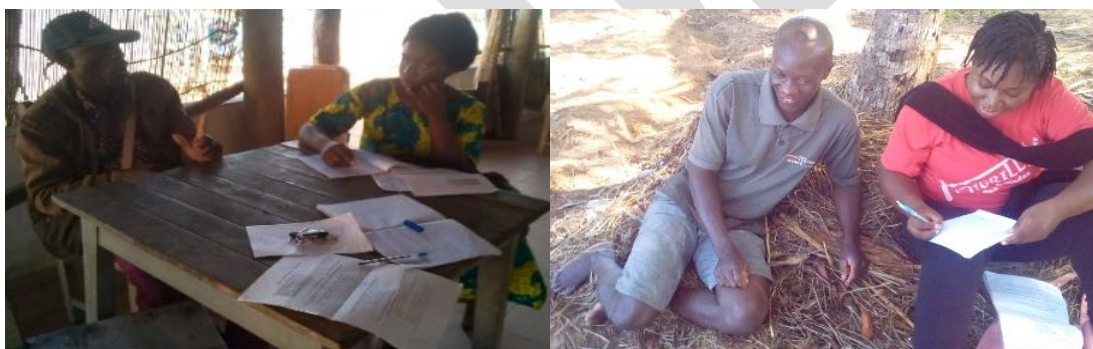
Enquête auprès des producteurs / Campagne de sensibilisation

Cette visite a permis d'informer les autorités locales et les personnes ressources sur la mise en œuvre effective de la campagne pour la protection de la lagune de Ouidah. Elle a permis de mieux connaître les villages et de préparer les enquêtes qualitatives et quantitatives, afin de faciliter la collecte de données aux agents ; Cette visite a également contribué à valider une liste complète des villages agricoles pour la mise en œuvre de la campagne, certains villages étant des villages dont l'activité principale est la pêche suivie de petits commerces.