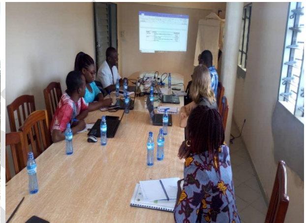
Atelier méthodologique du projet DERICC