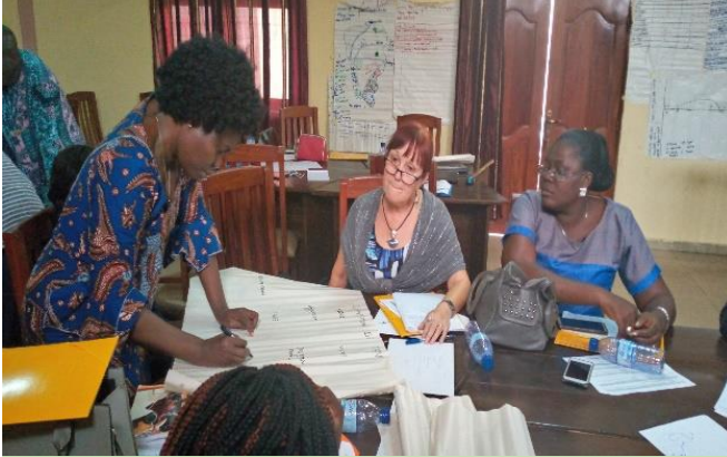
Atelier de formation sur le renforcement de capacités du projet DERRIC

L'objectif de cette formation est de renforcer les capacités de l'équipe projet sur les outils d'analyse de la Vulnérabilité et de la capacité d'Adaptation (CVCA) ainsi que sur l'intégration du Genre dans les activités du Projet. Elle a été animée par les représentants de CARE International et Gender at Work.