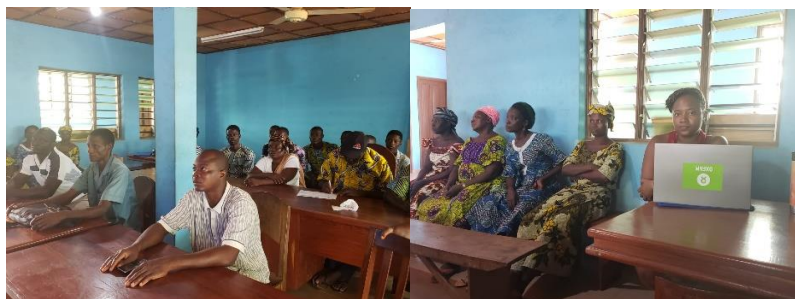
Séance de sensibilisation avec les maraichers

Les résultats de l'Atelier d'Analyse Participative des Risques et Vulnérabilités (APVR) ont permis de mener trois séries de sensibilisation auprès des agriculteurs bénéficiaires du projet dans trois arrondissements (Houakpè-Daho, Gakpé, Savi). Les agriculteurs ont été sensibilisés sur la gestion efficace des risques et les impacts des changements climatiques et sur les stratégies d'adaptation qu'ils doivent adopter pour une agriculture plus résiliente.