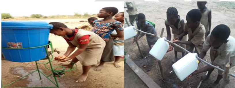
Promotion du lavage des mains, avec DLM EPP ADJIDJEDO

Dans le département des collines 167 cuisines respectent les normes sur 321. Soit un pourcentage de 52,02 %. La réalisation de cuisines appropriées reste un véritable défi à relever.