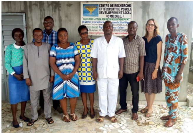
Une partie de l'équipe du projet avec l'administratrice de programme

Le but de cet atelier est de définir la stratégie de mise en œuvre du projet, d'analyser la démarche méthodologique de l'équipe du Laboratoire LACEEDE, chargée de conduire l'étude de référence et d'identifier les groupements bénéficiaires directs.