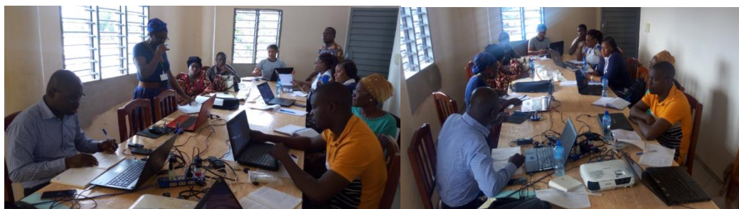
Réunion du comité de l'équipe de projet à Oxfam Bénin

Des sessions de réunions mensuelles de l'équipe projet (CREDEL, IDID et OXFAM) ont eu lieu afin de faire le suivi du projet. Ces réunions permettent de faire le point des activités réalisées, des difficultés et approches de solutions ainsi que la planification des activités du mois suivant.