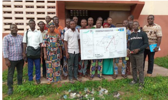
Validation de la carte des ressources en eau de l'arrondissement de Sèhouè. Commune de

La seconde vague d'activités mise en œuvre par le projet au cours de cette 1 ère année et qui vise à faire connaître la GIRE aux populations s'est concentrée sur les actions d'émulation. Dans cette lancée, la cartographie participative des ressources en eau des six communes d'intervention a été réalisée.