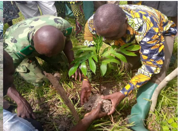
Reboisement des berges du Lac Hlan par le Maire et le RCPN de Zogbodomey

Enfin, le CREDEL a facilité un certain nombre d'activités conduites par ses partenaires Green SA et CIDR à travers la mobilisation des acteurs, la facilitation/organisation de certaines réunions et l'appui de proximité pour la réalisation d'actions ponctuelles (mobilisations des communautés du village Hon dans la commune de Zogbodomey pour les activités de reboisement des berges du lac Hlan, la facilitation de la collecte des données dans le cadre de la conduite de l'étude hydrologique et de la restitution de ses résultats, la collecte des données pour la détermination des audiences des radios communautaires partenaires du projet, la facilitation de la réalisation de l'étude d'impact environnementale du projet etc.).