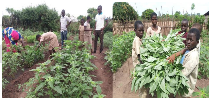
Jardin scolaire à EPP WOO -OTAA, décembre 2019

Les résultats de ces sensibilisations ont abouti à la mise en place de 127 jardins scolaires dans 127 écoles dont 51 déjà fonctionnels et produisant de la tomate, des légumes, du piment et du crinclin pour la cuisine. Les produits issus des jardins scolaires contribuent en grande partie au