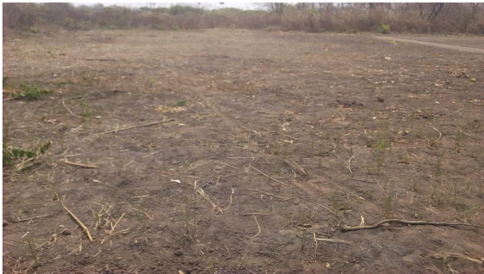
Photo 6 : Espace de 400m 2 en court d'aménagement à IDJOU dans la commune de Bantè pour le jardin scolaire

Des terres sont octroyées aux écoles afin de les cultiver (champs communautaires) et d'apporter les bénéfices au profit des écoles à cantine.