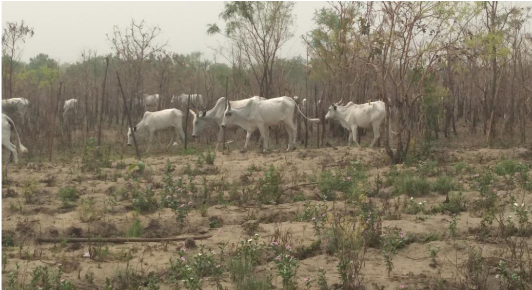
Photo 22: la transhumance des bêtes dans le jardin de l'EPP ayidjoko/A dans la commune de Savè

La transhumance est aussi un problème qui met en difficulté les jardins et champs scolaires ; les sensibilisations sont en cours,