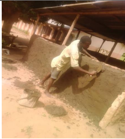
Construction de murettes