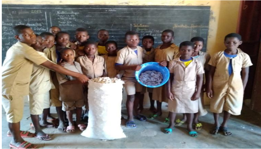
Photo 9 : apport communautaire de 70Kg de cossette à l'EPP Ekpatico dans la commune de savalou

L'accompagnement des autorités communales à également permis d'améliorer l'état des infrastructures dédiées à la cantine. C'est le cas à Ouèssè, où l'appui financier du maire à permis de payer des tôles pour rénover la cuisine des EPP GBEDE et ANSEKE