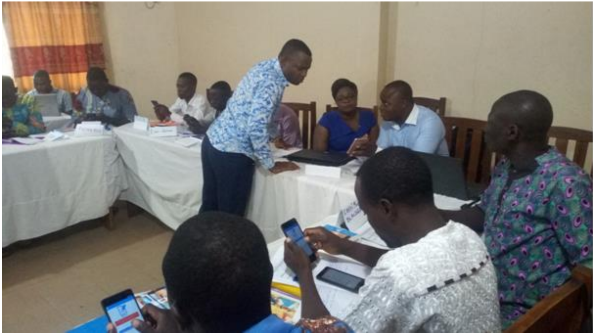
Photo 2 : Apprentissage de l'utilisation du MDCA par les animateurs

du Mobile Data Collection et Analytics (MDCA), un outil de collecte de donnée au moyen de l'application MDCA installée sur les androïdes.