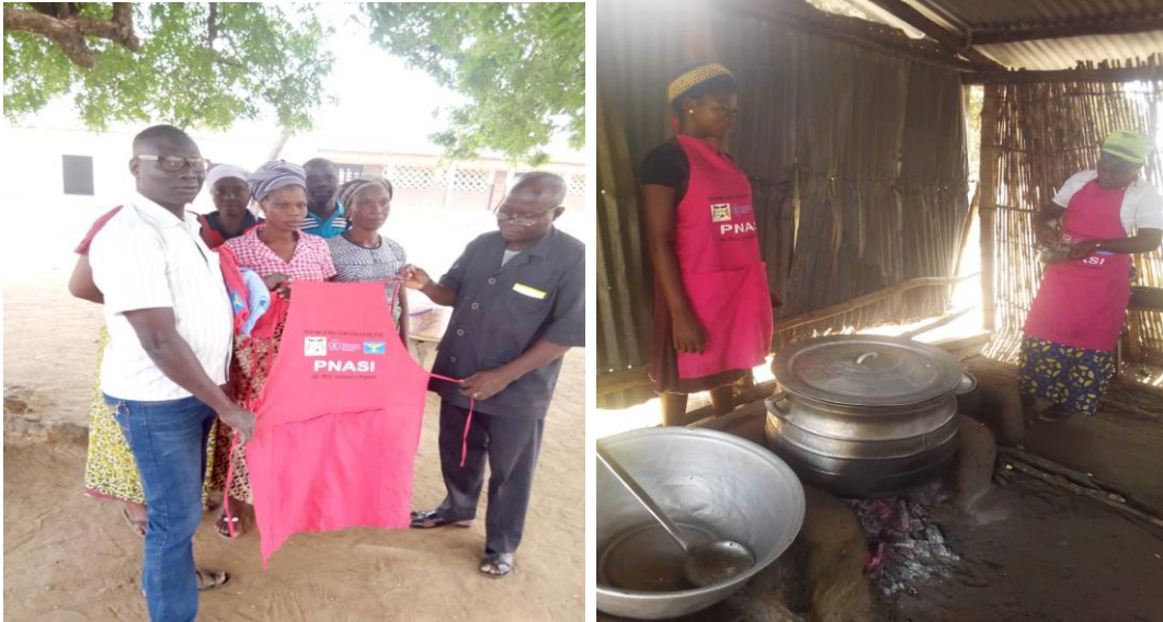
Photo 11 : Remise des tabliers confectionnés par l'ONG CREDEL aux cuisinières

En vue d'accompagner ces cuisinières, qui de façon bénévole se donnent à la tâche, l'ONG CREDEL a pris l'initiative de confectionner des tabliers et des foulards à toutes les cuisinières de toutes ces écoles à cantine du département des Collines. Les médiateurs ont procédé à la remise officielle des tabliers et foulards aux directeurs