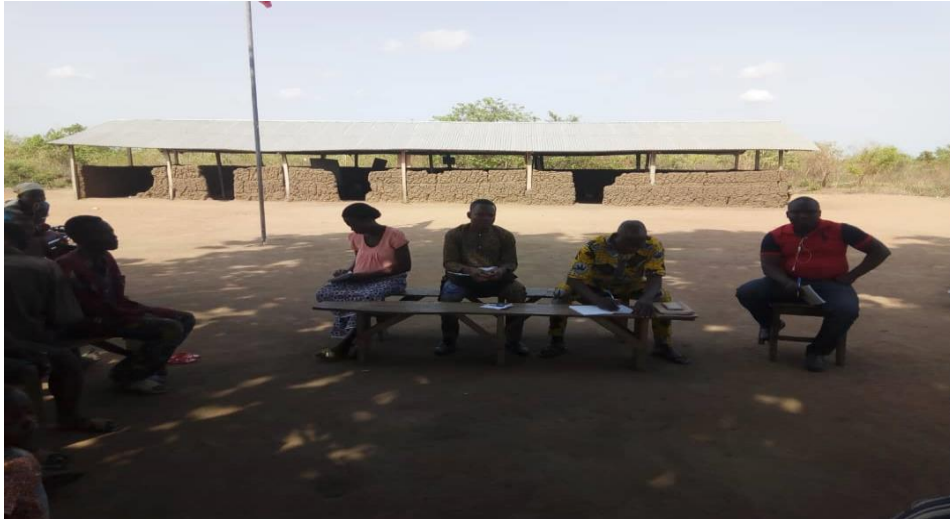
Photo 5 : AG suivie d'un appel de fond « zindo » à l'EPP Agbasso dans la commune de Savè