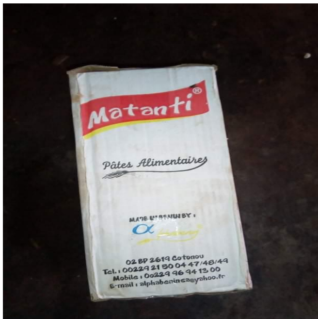
Photo 8 : Don d'un carton de spaghetti par la communauté de l'EPP Agboro-Idouya dans la commune de Ouèssè

De divers dons en nature, constitués d'igname, tomates fraîches, poissons, piments, fromages, œufs, maïs, etc... à hauteur de 684 Kg ont été donné par les communautés aux écoles à cantine.