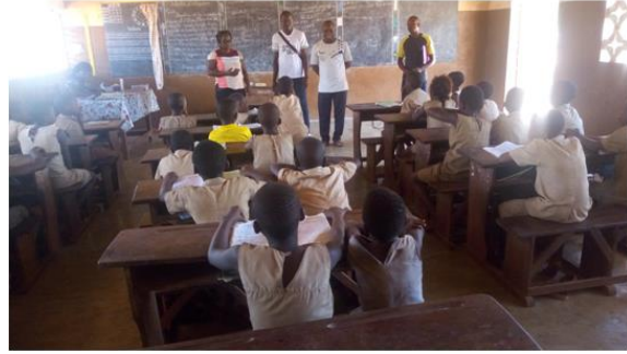
Photo 4 : Entretien avec les Cuisinières de EPP Adihinlidji (Dassa) à gauche et séance de sensibilisation dans les classes à EPP Manaboè à Bohicon à droite