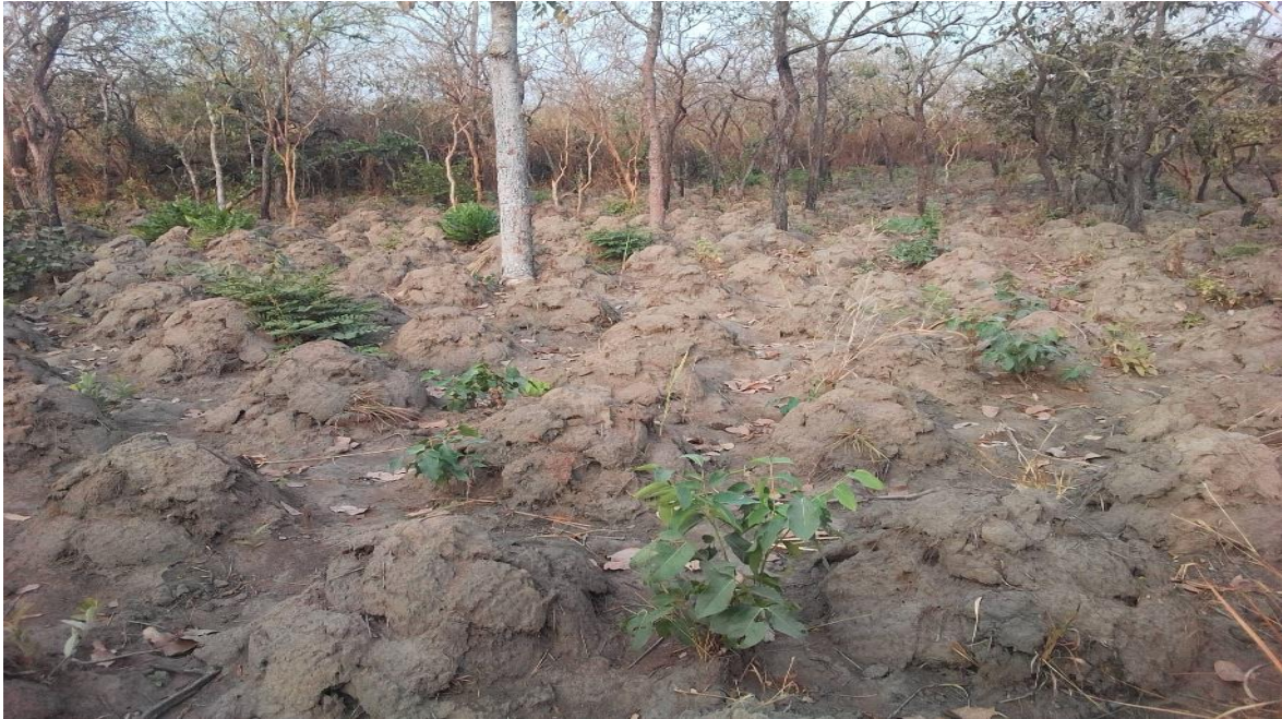
Photo 7 : Un champ d'igname de 120 lignes en cours de réalisation à l'EPP Otikongni dans la commune de Bantè

De divers dons en nature, constitués d'igname, tomates fraîches, poissons, piments, fromages, œufs, maïs, etc... à hauteur de 684 Kg ont été donné par les communautés aux écoles à cantine.