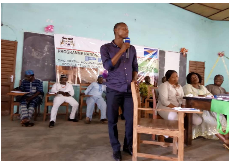
Photo 21 : Directeur de l'EPP Thio/C, école modèle prenant la parole lors de la séance de sensibilisation de la mission conjointe à Dassa