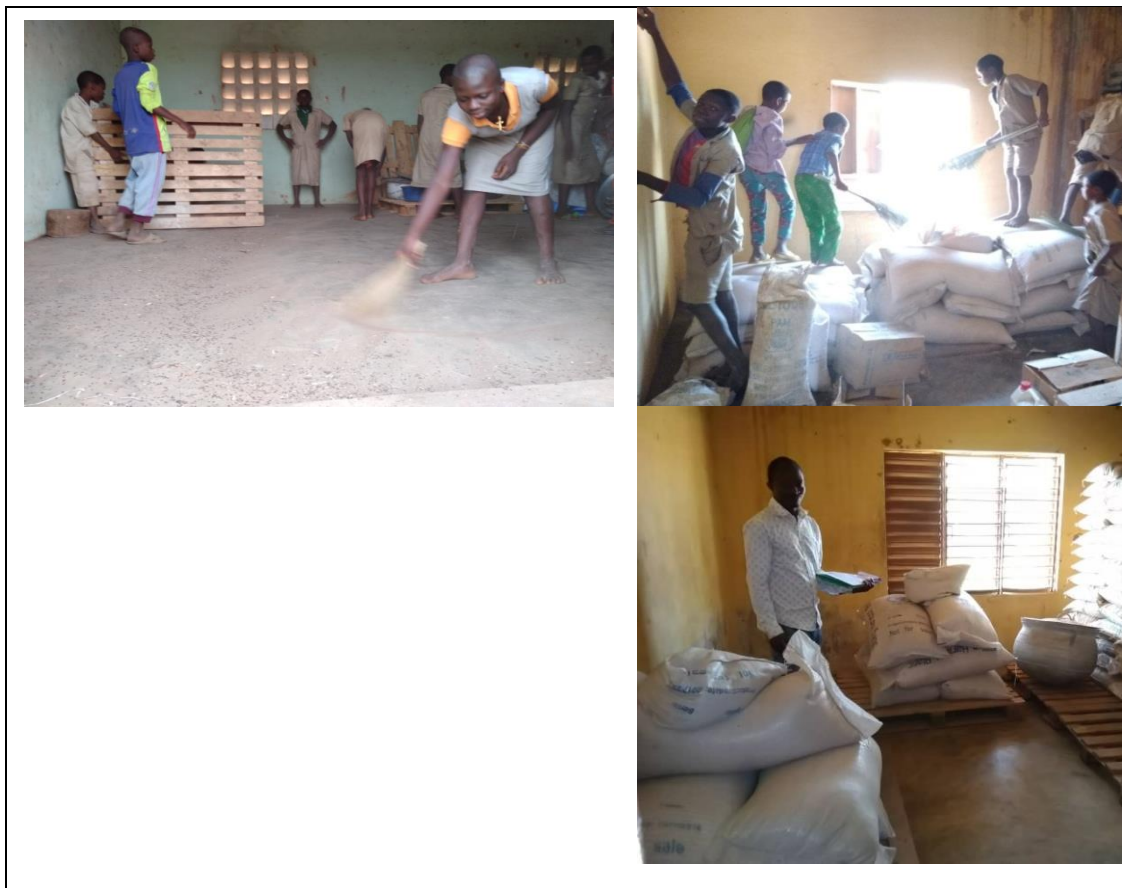
Photo 17: Séances d'entretien de magasins de stockage et arrimage des vivres à l'EPP Coffé- Agballa et Akpaki dans la commune de Savalou