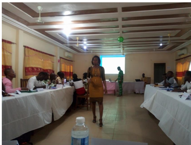
Photo 3 : Présentation des modules de formation par les formateurs

Toujours dans la poursuite de ces objectifs de former des ONG compétentes, le PAM organise la dernière série sur l'éducation nutritionnelle qui s'est tenue à l'hôtel fifatin de Bohicon du 13 au 15 Mars 2019. L'objectif général est de renforcer les connaissances des animateurs et superviseurs sur les notions de base en nutrition afin de leur permettre d'organiser les séances d'éducation nutritionnelle dans les écoles à cantine