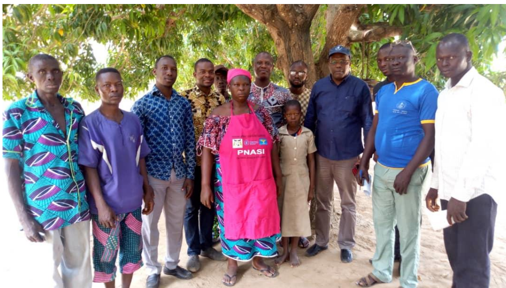
Photo 20: visite du coordonnateur national du PNASI en visite à l'EPP Tankossi dans la commune de Glazoué