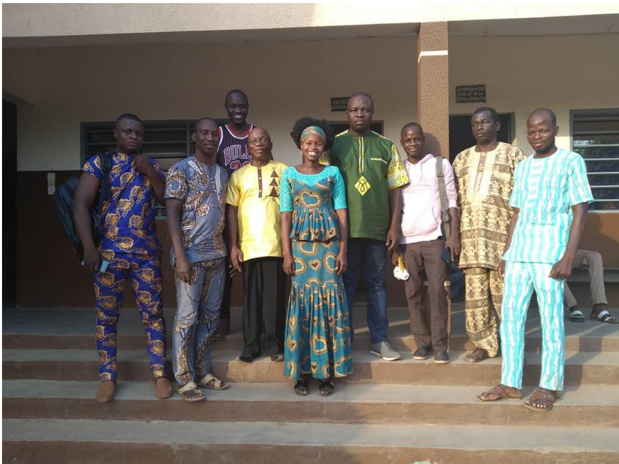
Photo 10 : Rencontre du Maire de Ouèssè par l'équipe de l'ONG CREDEL de la commune

L'accompagnement des autorités communales à également permis d'améliorer l'état des infrastructures dédiées à la cantine. C'est le cas à Ouèssè, où l'appui financier du maire à permis de payer des tôles pour rénover la cuisine des EPP GBEDE et ANSEKE